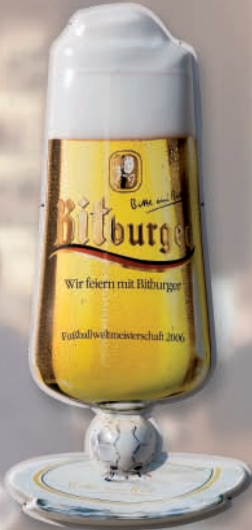
Bit-Pokal tiefgezogen, Originalgröße 1,80 Meter