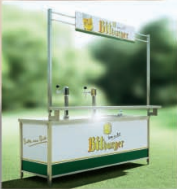
Thekenplatten und Werbebogen

Innovation und Kreativität, Produkte in Top-Qualität und das »ALLES AUS EINER HAND«